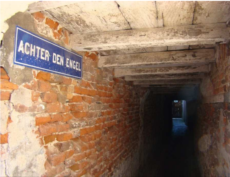
Het steegje Achter den Engel bevindt zich tussen Vughterstraat 201 en 203 én tussen Westwal 26 en 27.

Sommige Achter-straatjes zijn gesloopt, meestal tijdens de renovatie van een volkswijk, zoals De Pijp, Diepstraatwijk, Beurzekiet. Een voorbeeld hiervan is Achter de Raam, ooit gelegen in De Pijp. De straatnaam verwijst naar de vroegere wolnijverheid. Het herinnert aan de houten stellages of ramen, waarin de pas gevulde of geverfde wollen lappen gespannen werden. Een ander voorbeeld van een gesloopt Achter-straatje is Achter den Steenoven. Het was een van de vele zijsteegjes aan de Brede Haven. De straatnaam verwijst naar een hoekhuis dat De Steenoven heette, nu staat er een appartementencomplex.