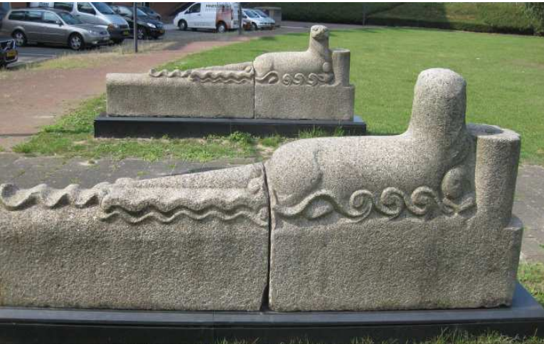
Twee otters, in 2015 herplaatst aan het Schout van Hanswijkplein.

Een apart verhaal zijn de twee “otters” die vanaf 1986 links en rechts de ingang sierden van het Brabantbad aan de Van Grobbendoncklaan 10. Het bad werd in 1998 gesloopt waarna de beelden enige tijd in opslag verdwenen. Inmiddels staan ze aan het Schout van Hanswijkplein in de Maaspoort.