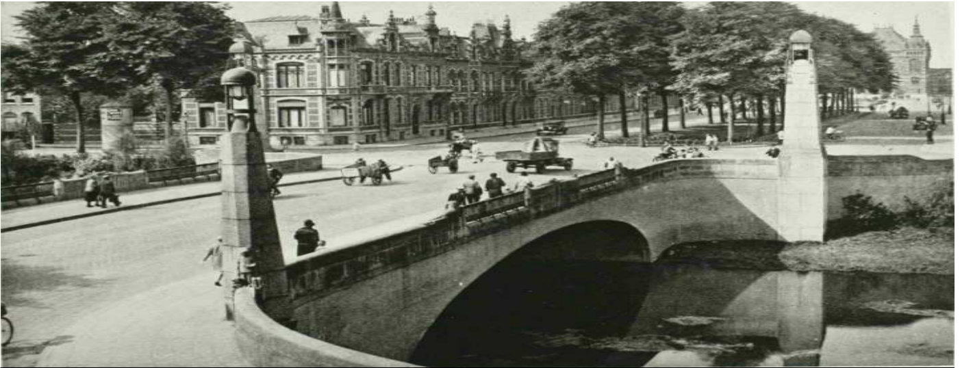
Wilhelminabrug gezien in de richting van de Stationsweg. 1930. Rechtsvoor op de pyloon het beeld van Jeroen Bosch (met schilderspalet), midden op de leuning twee zeehonden.

Die brug verkeerde enkele jaren later al in gevaarlijke slechte staat en men drong er bij de gemeente op aan om maatregelen te nemen. Ondanks het gevaar voor mens en dier, werd er van 1920 tot en met 1922 gekibbeld over de noodzaak om de slechte brug te vervangen en hoeveel geld men hieraan wilde besteden.