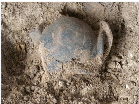
Kogelpot of bouwoffer? Eilard Naeff kwam in de Duitse krant! Lees er alles over op pagina 17.