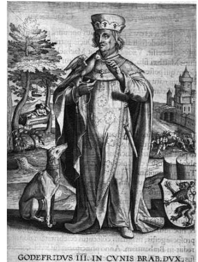
GODEFRIDVS III. IN CVNIS BRAB. DVX. 201

Na de geboorte van het eerste kind van graaf Hendrik van Namen en Luxemburg bood Godfried hulp aan de oude graaf die op hoge leeftijd alsnog nog een dochter kreeg. Er was overeengekomen dat zijn neef, Boudewijn V graaf van Henegouwen, zijn leengoed zou overnemen. Omdat zijn oom de afspraak niet nakwam vanwege zijn