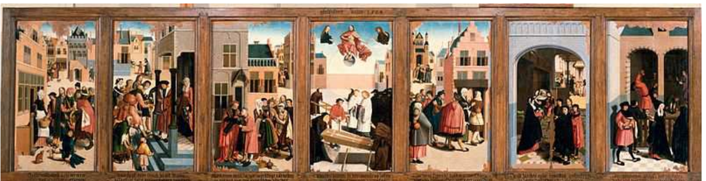
Afb. 3: Cornelis Cornelisz. Buys I: De zeven lichamelijke werken van barmhartigheid