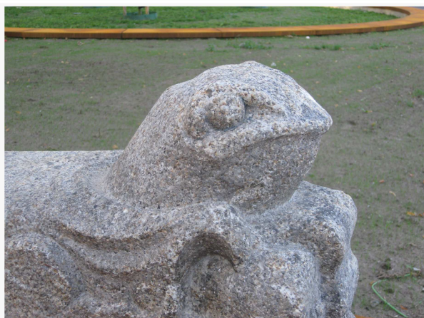
Van de brug gesprongen? Waar staat deze vrolijke snuiter? Lees meer op pagina 5.