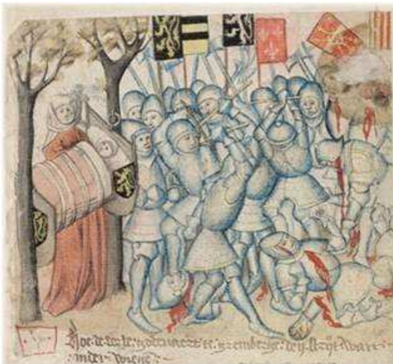
Godfried III werd in de Grimbergse oorlog in zijn wieg opgehangen tijdens de slag tegen de Berthouts in 1142. Zo werd hij bekend als “de hertog in de wieg”.

Het domein Orthen en zijn bewoners, dat omstreeks 1120 in bezit kwam van het huis Leuven en later tot stad uitgroeide, werd in de geschriften van het jaar 1195 omschreven als “ de nieuwe stad boven het bos in de buurt van Orthen ”. In 1196 “ de mannen van de nieuwe stad bij het bos ”. In 1203 “ de burgers van het bos bij Orthen ”. In 1204 “ Orthen dat nu bos genoemd wordt ”. En in 1213 “ Oppidani de Buscoducis ”, de burgers van ’s-Hertogenbosch. “ Buscoducis ”, zoals ’s-Hertogenbosch in het Latijn toen werd genoemd groeide gedurende de 13 de en 14 de eeuw uit tot een van de belangrijkste steden van het hertogdom Brabant