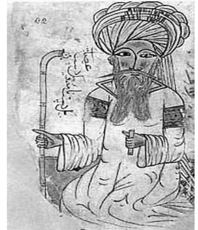
Avicenna in een manuscript uit 1271

Iemand die zeker niet mag ontbreken in dit, noodzakelijk beknopte, overzicht is de Perzische 10 e -eeuwse alleskunner Avicenna . Geoloog, antropoloog, wiskundige, filosoof, natuurkundige en arts; hij was het allemaal. Hij was het wonderkind van de 10 e eeuw in de Arabische wereld. En passant schreef hij een medisch standaardwerk van meer dan een miljoen woorden. Hij onderzocht o.a. besmettelijke ziekten, soa's, deed klinische testen met medicijnen, was fervent voorstander van quarantaine bij besmettelijke ziekten en ontwikkelde diagnosetechnieken. En ook beschreef hij de complicaties en symptomen van suikerziekte met bijbehorende therapieën. Als hij opereerde dan paste hij verdoving toe en hij wist al verschil te maken tussen centraal en perifeer zenuwstelsel bij aangezichtsverlammingen. Hij benadrukte nadrukkelijk het belang van goed water en voeding voor