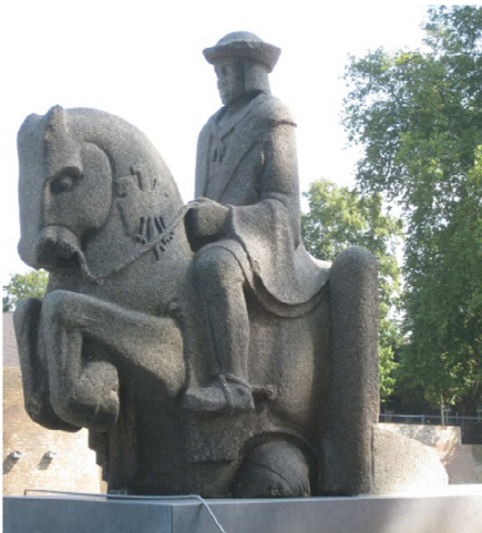
Maximiliaan van Oostenrijk, in 2015 herplaatst aan de Pettelaarseweg, nabij Parkeergarage Sint Jan.

Deze prachtige brug werd helaas bij de bevrijding in 1944 zwaar beschadigd. In 1954 werd de brug vervangen door het huidige exemplaar.