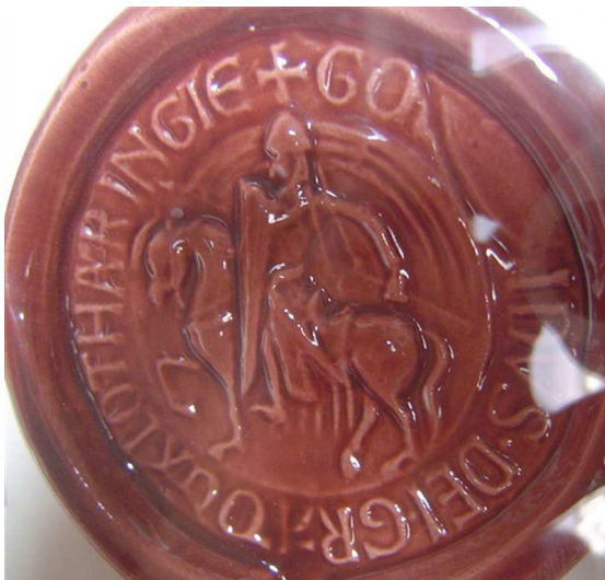
Replica van het zegel van Godfried III

Godfried werd in zijn regeringsperiode voogd van Tongerlo en de graafschappen Aarschot (voor 1179) Geldenaken (1184) en Duras (1189). Na de dood van zijn eerste vrouw Margaretha in 1172 hertrouwde hij in 1180 met Imagina van Loon (1150-1214) dochter van graaf Lodewijk I van Loon. Zij kregen twee zonen Willem en Godfried. Imagina werd na de dood van haar man in 1190 maar nog voor het jaar 1203 abdis van de abdij Munsterbilzen. Adellijke vrouwen traden na de dood van hun echtgenoot in die periode vaker in het klooster.