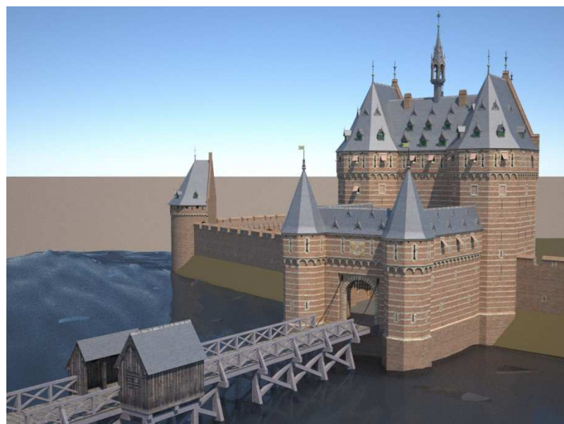
Pyckepoort rond 1500 in 3D-weergave