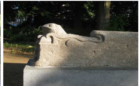
Twee kikkers, in 2015 herplaatst in de Casinotuin, aan weerszijden van de doorloop naar de brug over de Dieze, richting Cavaleriestraat.

Minder opvallend waren de kikkers die het Henri Bakkermonument flankeerden. Nu, in 2015, zijn ze opnieuw op een ander plekje gezet waar ze veel beter tot hun recht komen; bij de nieuwe parkeergarage Sint Jan aan de Hekellaan en in de Casinotuin.