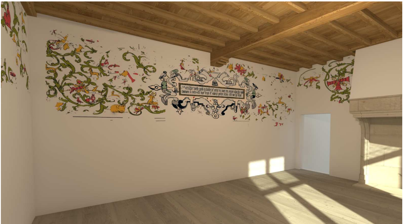
Interieur Hinthamerstraat 138 in 3D-weergave

Van Hinthamerstraat 138 reconstrueren we het interieur met laatgotische schilderingen. De gevonden fragmenten geven al een goed beeld hoe kleurig de kamer indertijd was.