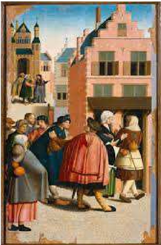
Afb. 1: het herbergen van vreemdelingen

In het lab hangen vier uitvergroete schilderijen en twee daarvan wil ik graag toelichten.