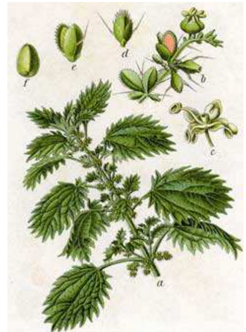
Urtica Urens. Uit: Johann Georg Sturm; Deutschlands Flora in Abbildungen. 1796

In de geschiedenis neemt deze plant een prominente plaats in. Zo weten we van de Romeinen dat ze zich inwreven met de