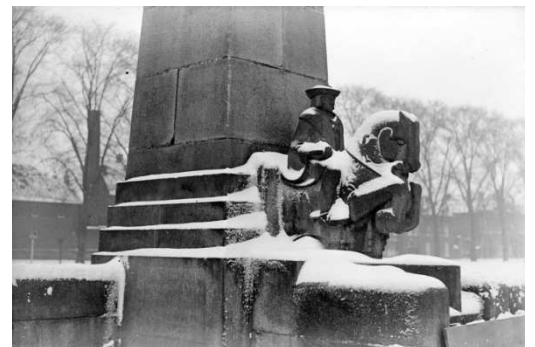
Besneeuwde Maximiliaan van Oostenrijk bij de Wilhelminabrug aan de zijde van de Van der Does de Willeboissingel. 18/01/1940.

Aan de uiteinden van de brug zaten vier kikkers, die "de ligging van den stad in den watervloed en de lage ommelanden" symboliseerden. Eveneens in verband met dit "waterkarakter" werden voor de overgang van de leuning naar de hekwerken vier zeehonden aangebracht.