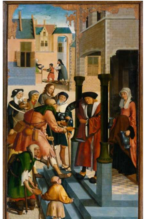
Afb. 2: Het laven van dorstigen

Als achtergrond gebruikt de kunstenaar fantasiegebouwen om de illusie van een stad te creëren. De stad is neergezet als een decor in een toneelstuk. Het gaat in deze schilderijen om de mensen en om wat ze doen. De stad zelf als onderwerp voor schilderkunst ontstaat pas in de 17de eeuw. Dan gaan schilders de stad als stad afbeelden. Het zijn dan geen fantasiesteden of fantasiegebouwen meer, maar in veel gevallen is duidelijk herkenbaar welke stad, en soms welke straat of gebouw wordt afgebeeld. Schilders beginnen zich te specialiseren in het schilderen van stadsgezichten en gebouwen.