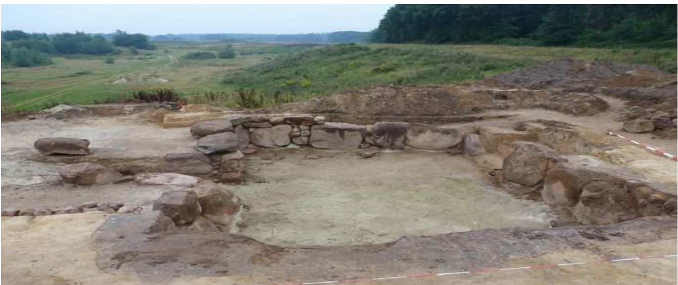
Midden in de landerijen van het Oldenburger land ligt de al half uitgegraven kelder

Bij tijd en wijle gecorrigeerd door Michael, maar ook in de loop van de week door elkaar. Bij de vondst van een scherf aardewerk wil je soms te ongeduldig weten wat er nog meer onder dat zwarte stukje zit. Zoals het er misschien al duizend jaar onder het zand bedolven ligt, kan dat uurtje geduld om te zorgen dat het goed