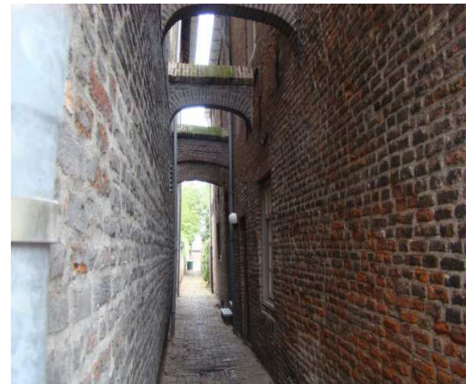
Het steegje Achter het Fortuintje verbindt de Vughterstraat met de Parklaan, het heeft vijf karakteristieke lichtbogen.

Een ander voorbeeld van een naamsverandering van een Achterstraatje is Achter de Brueren, deze liep achter het Minderbroedersklooster. In 1611 was de naam Koffermekersstraat, in de tweede helft van de 17 e eeuw werd die gewijzigd in de Snellestraat. Deze laatste naam verwijst naar een woonhuis met de huisnaam De Drie Snellekens, gelegen Snellestraat 32. Een snel is een drinkbeker. De huidige Scheidingstraat heeft in het verre verleden ook Achter den Gapert en Achter de Zwarte Hond geheten. Het grote hoekhuis Scheidingstraat/Hooge Steenweg werd opgesplitst: in 1571 was het rechtergedeelte een brouwerij met de naam De Gapert. In 1610 kreeg het linkergedeelte de naam De Zwarte Hond. Vandaar de straatnamen.