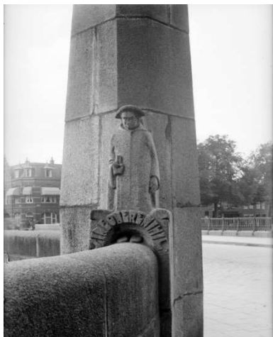
Sonnus met daaronder zijn wapenspreuk "Sine onere nihil" aan de zuidoost-pyloon van de Wilhelmina-brug..27/06/1933. Verwoest in 1944

In 1923 werd dan uiteindelijk het derde exemplaar gerealiseerd dat de naam Wilhelminabrug kreeg. De onderbouw werd opgetrokken uit beton. De brug werd voorzien van vier pylonen die werden bekroond met lantaarns. In eerste instantie werden de leuning van de oude brug overgezet op de nieuwe; men wilde nog niet investeren in een monumentale bovenbouw.