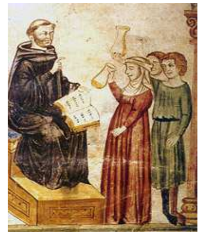
Constantijn de Afrikaan

ibn al-Abbes al Majusi, was tot in de 16 e eeuw verplichte kost in de westelijke Europese universitaire opleidingen. Het is dan ook vertaald in het Middelnederlands in een Vlaamse uitgave in Brugge. Al vanaf de 10 e eeuw gingen diegenen die het aankonden, en geld hadden om zo ver te reizen voor behandelingen, naar Salerno toe. Meerdere hooggeplaatsten uit Frankrijk en noordelijker streken meldden zich ter plaatse voor genezing. De faam was zelfs zo groot dat keizer Frederik de Tweede alleen die artsen vergunning verleende als ze in Salerno hadden gestudeerd. Er was daar dan ook wat aan de hand want langzaam ontsteeg men er het puur praktische genezen en ging men steeds meer de weg van de theorievorming. Er ontstond zo een medische leer met een ondersteunende farmacologie, een chirurgische tak en voor het eerst ook een verloskundig, gynaecologische kennisleer met een beroemde lerares: Trotula van Salerno .