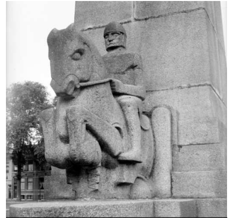
Hertog Hendrik aan de noordwest-pyloon van de Wilhelminabrug. 27/06/1933 Verwoest in 1944

De pylonen aan de stationszijde kregen elk een ruiterstandbeeld; hertog Hendrik van Brabant (symbool van stoffelijke welvaart) en Maximiliaan van Oostenrijk (bloei van de stad).