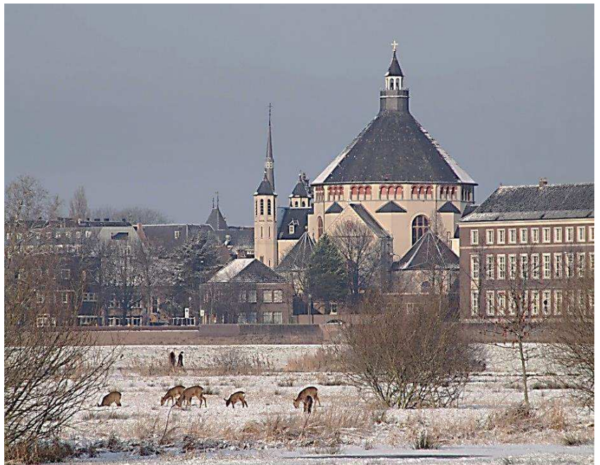
Reeën in het Bossche Broek, vlak voor de stadswal, winter 2013

Voor een heel andere blik op de stad loont het de moeite om eens vanuit Vught, via de wandelpaadjes in het