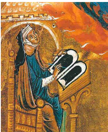
Hildegard von Bingen

de gezondheid. En hij beschreef de weg van het bloed door het lichaam en de functie van het hart hierbij.