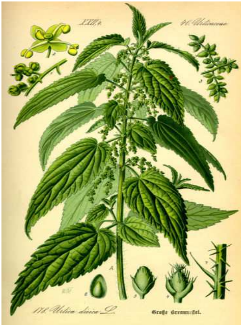
Urtica dioica. Uit: Prof. Dr. Otto Wilhelm Thomé Flora von Deutschland, Österreich und der Schweiz 1885, Gera, Germany

De middeleeuwer noemde het de Heete netelen . Volksnamen zijn o.a. ook nog duivelskruid , gemene netel , broeinetel en tingels . Treffende benamingen en die zien we ook in ons omringend gebied: Stinging nettle , Brennessel .